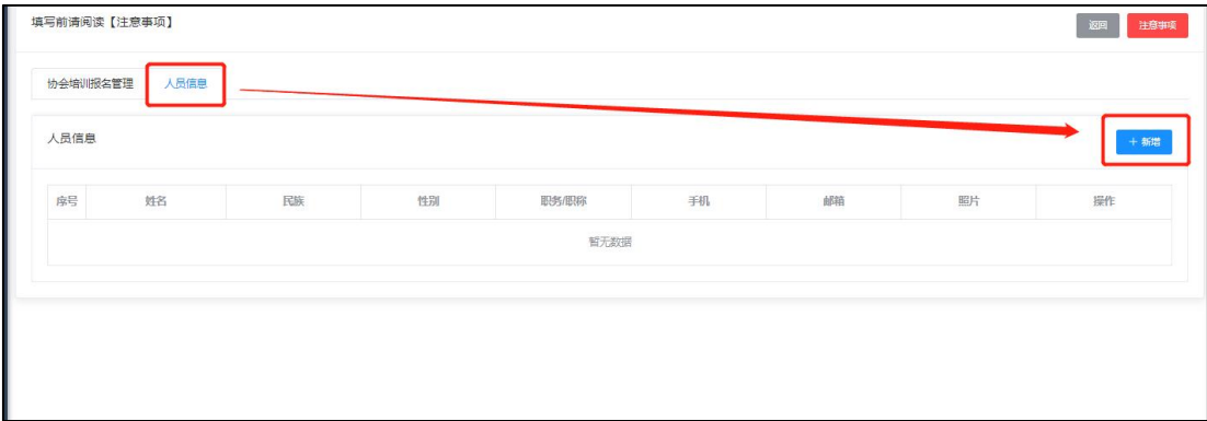
图 4 人员信息添加

单位信息保存后，可【新增】多个参加培训的人员信息，需要培训证书的学员可上传 1 寸蓝底照片（图 4 和图 5）。