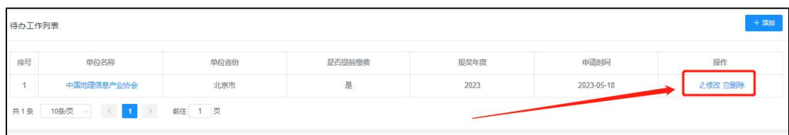
图 7 培训信息修改

培训报名时间区间内可对信息进行修改和删除，系统将实时同步修改信息或删除培训报名记录（图 7）。