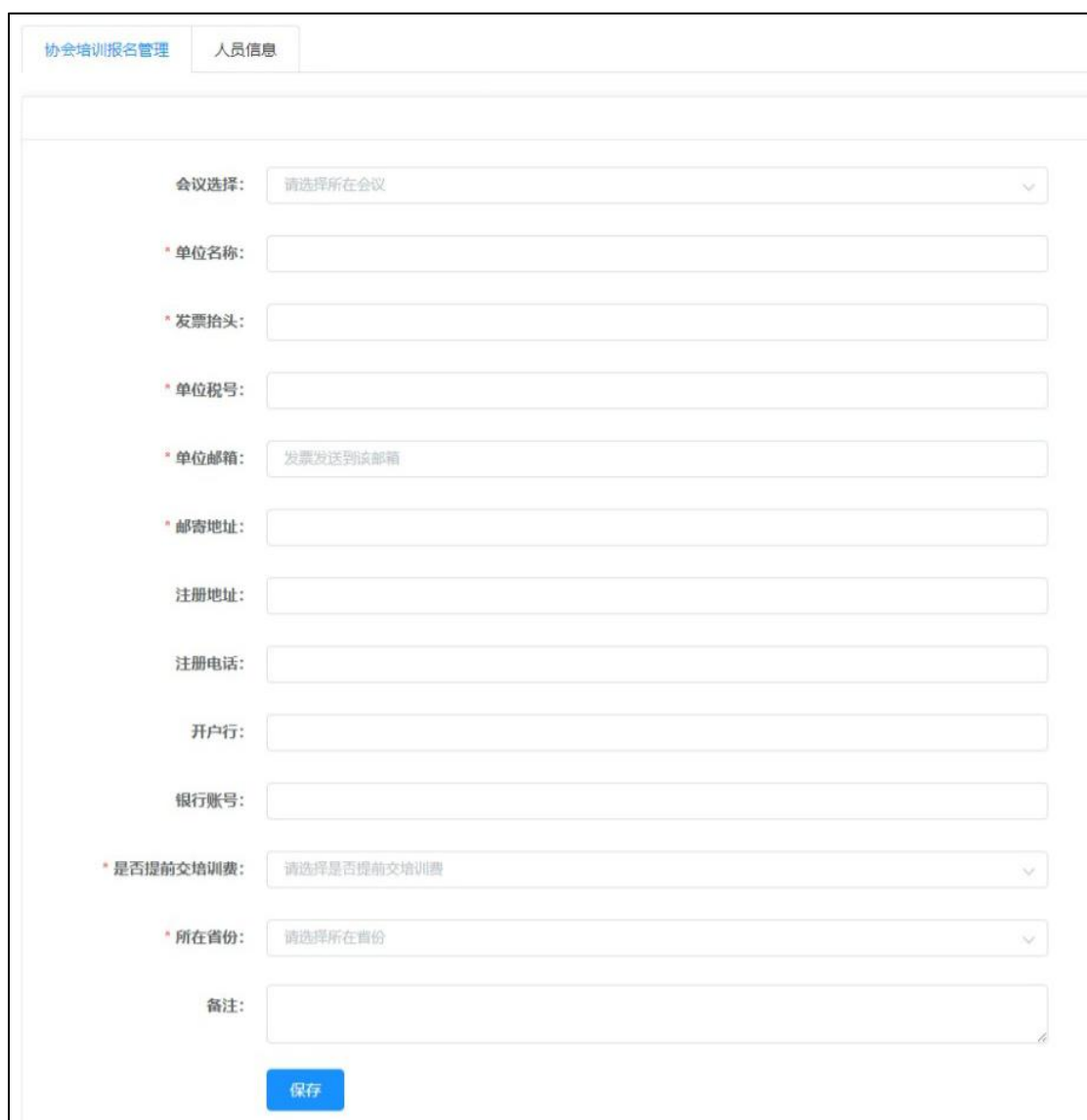
图 3 单位信息录入

【会议选择】中选择本次培训会议，其余信息按照单位真实信息进行补全，后续发票信息将按照此信息进行开具发送到【单位邮箱】中；填写完成后点击【保存】按钮保存填写内容（图 3）。