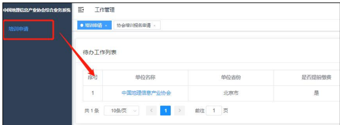
图 6 培训信息显示